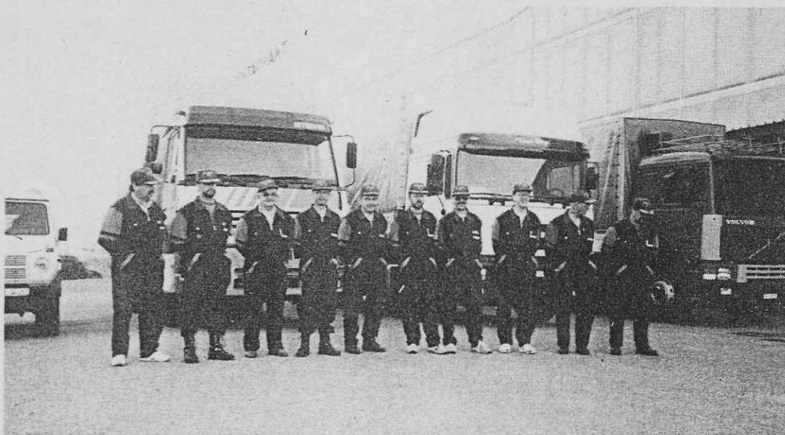
Verfassung und Fotos : Heinz Marti

Um ein einheitliches Erscheinungsbild der Mannschaft zu gewährleisten, hat die Firma MOTOREX in Langenthal jedem Fahrer und Begleiter ein Arbeitskombi mit Mütze zur Verfügung gestellt. Zusätzlich wurden die Teilnehmer mit neon-gelben Wetterschutzjackets der Firma B.+D. Jaussi, Berufs- und Sicherheitsbekleidung, Urtenen , ausgerüstet.